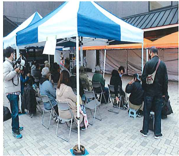
NIKKO ストロベリーフェスタ