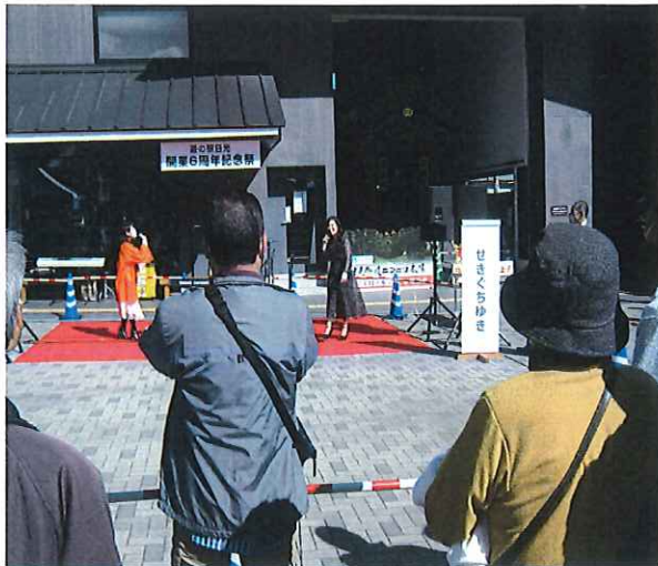
開業6周年記念イベント