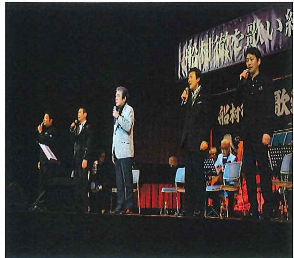
船村 徹を歌い継ぐ演歌巡礼