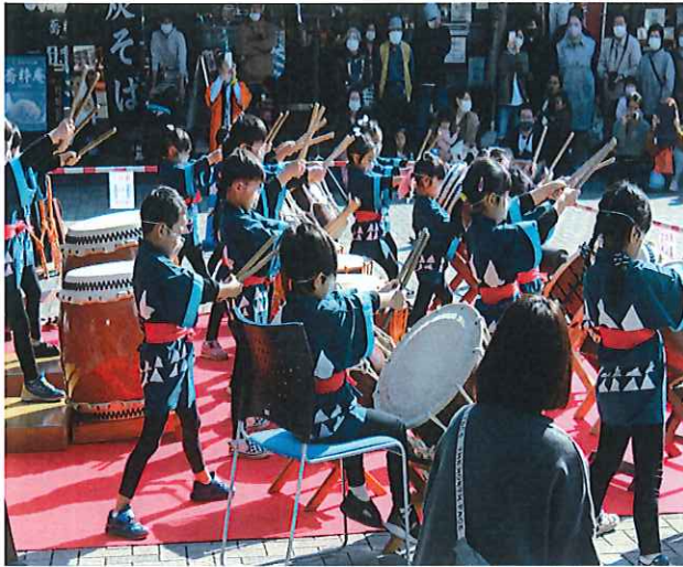
開業6周年祭イベント