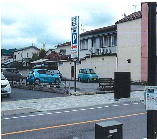
住吉町道の駅日光兼 商店街お買い物お客様共同駐車場