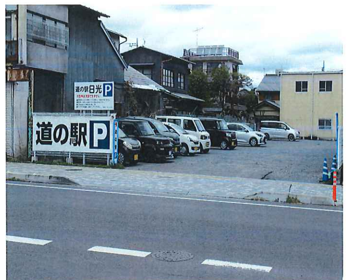
道の駅日光 臨時駐車場