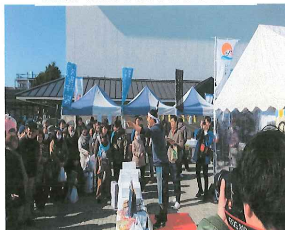
日立うまいもんマルシェ