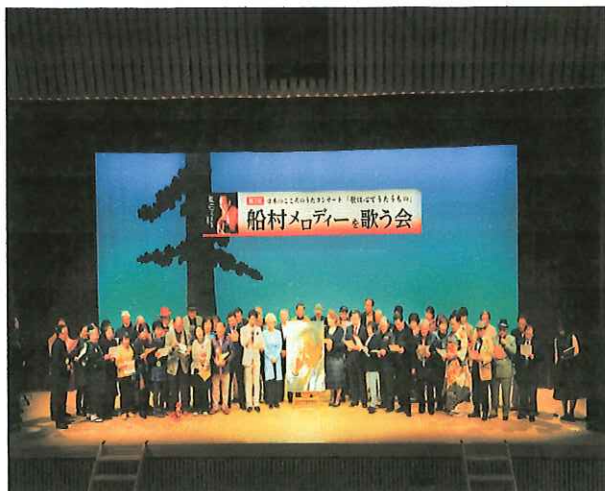
船村メロディーを歌う会