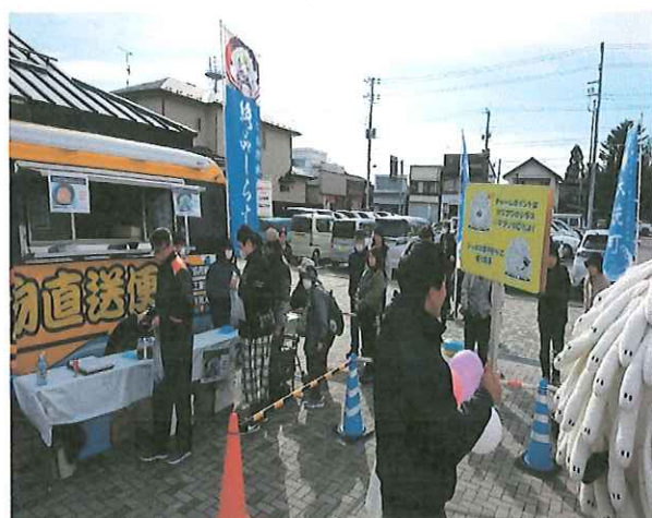
大洗うまいもの市