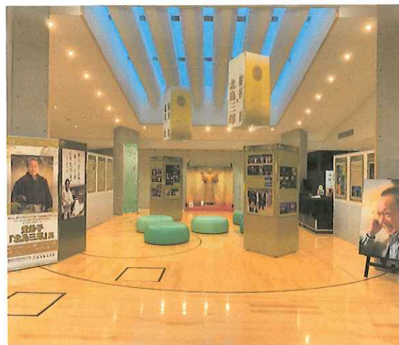
愛弟子 北島 三郎展