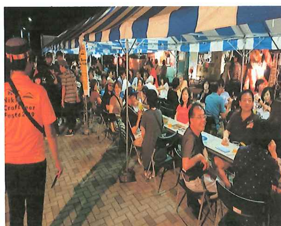
Nikko Craft Beer Festa 2019