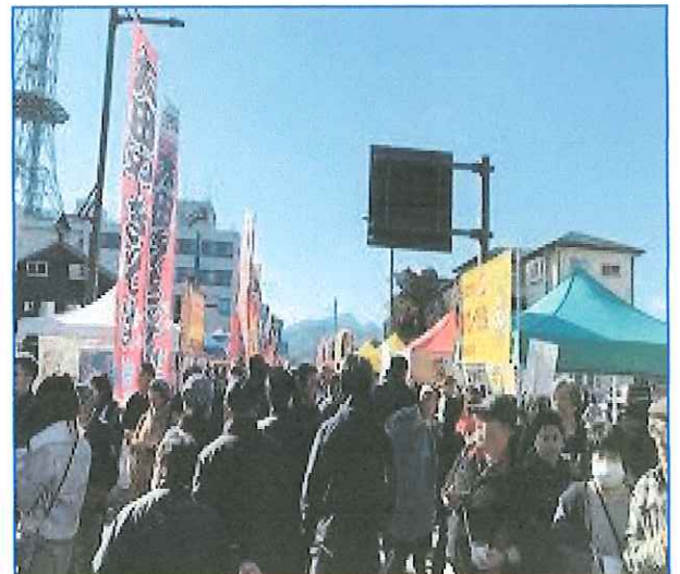
日光焼きそばまつり2019