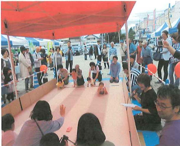
赤ちゃんハイハイ選手権

まちづくり市民ボランティア団体である、「にぎわいのあるまちづくり研究会」が主催する「今市宿六斎市」への協力を行い、街中に賑わいを創出しました。