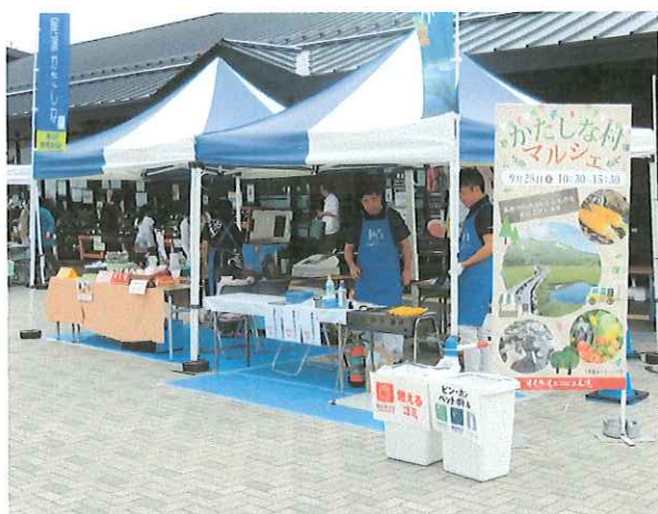
かたしな村マルシェ