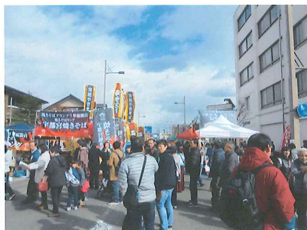
日光焼きそばまつり2017