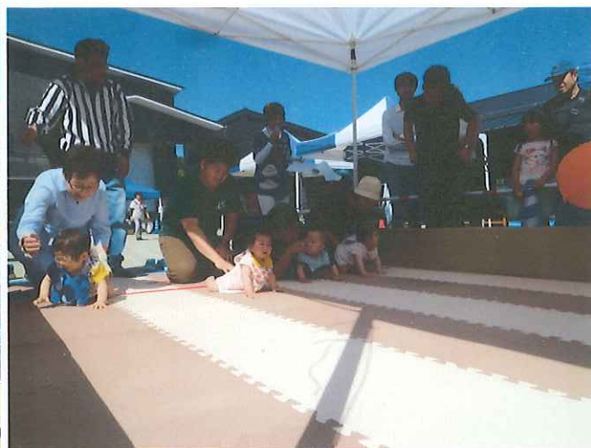
赤ちゃんハイハイ選手権