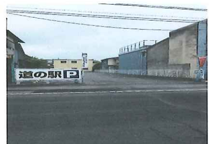
大塚カラー今市駐車場