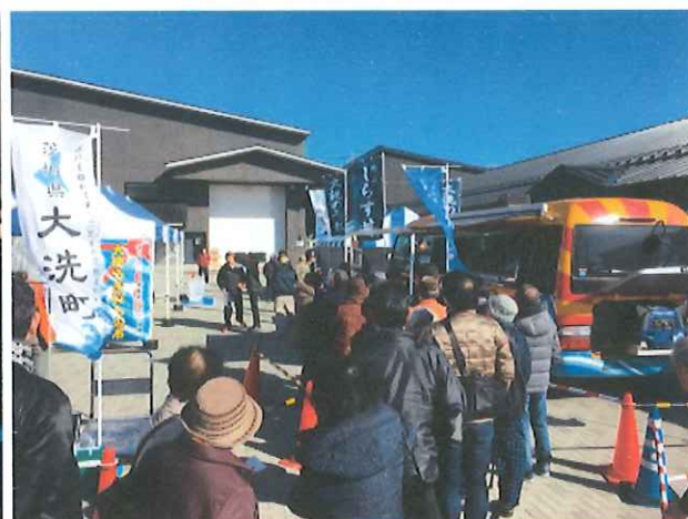
大洗うまいもの市