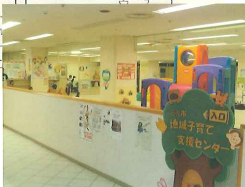
子育て支援センター