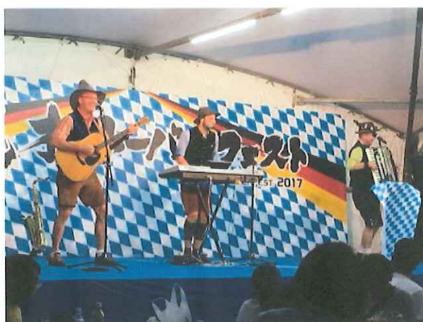
日光オクトーバーフェスト2017