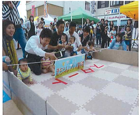
赤ちゃんハイハイ選手権