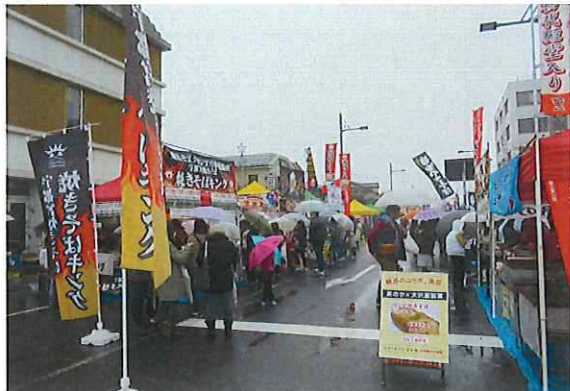
日光焼きそばまつり

平成27年11月23日（月・祝）日光そばまつりの一環事業として、「にぎわいのあるまちづくり研究会」が主催する「日光焼きそばまつり」への協力を行い、賑わいを創出した。当日は29店の参加をいただき、会場を盛り上げた。