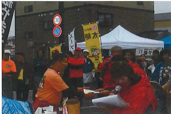
日光焼きそばまつりグランプリ表彰