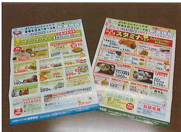
お買い物情報等広報チラシ