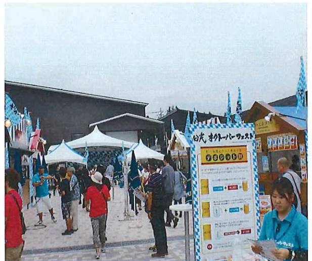
オクトーバーフェスト