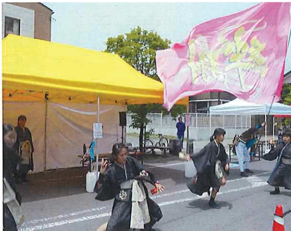
ダンスパフォーマンス

毎月第3土曜日、JR今市駅前通りの一部を車両通行止めにして、まちづくり市民ボランティア団体である、にぎわいのあるまちづくり研究会が主催する「今市宿六斎市」への協力を行い、街中に賑わいを創出した。