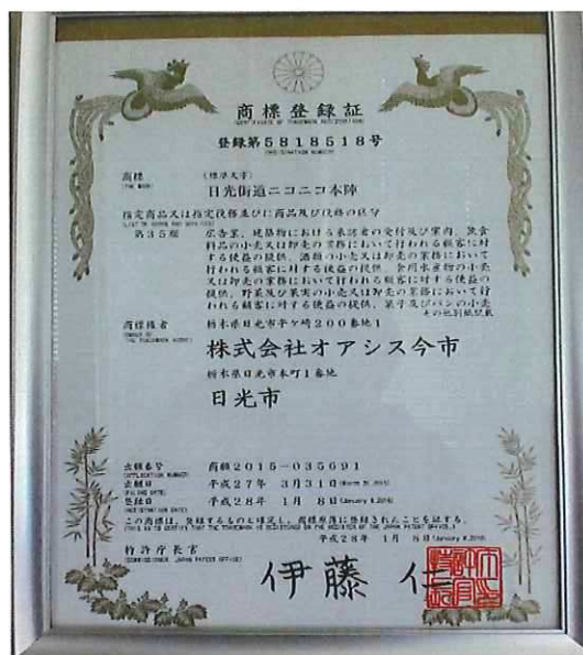
商標登録証（登録第 5818518 号）

○当社及び日光市との連名にて出願していた、「日光街道ニコニコ本陣」（標準文字）が、平成28年1月8日に商標登録された。