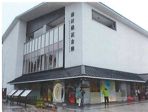
平成 27 年 4 月 27 日日光街道ニコニコ本陣グランドオープン