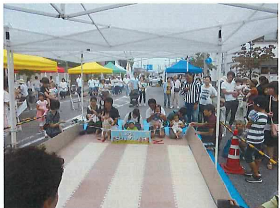
赤ちゃんハイハイ選手権