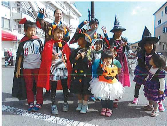
ハロウィン仮装コンテスト

毎月第3土曜日、JR今市駅前通りの一部を車両通行止めにして、まちづくり市民ボランティア団体である、にぎわいのあるまちづくり研究会が主催する「今市宿六斎市」への協力を行い、街中に賑わいを創出した。