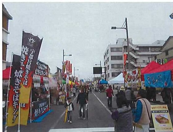
日光焼きそばまつり

平成28年11月20日（日）日光そばまつりの一環事業として、「にぎわいのあるまちづくり研究会」が主催する「日光焼きそばまつり」への協力を行い、賑わいを創出した。当日は32店の参加をいただき、会場を盛り上げた。