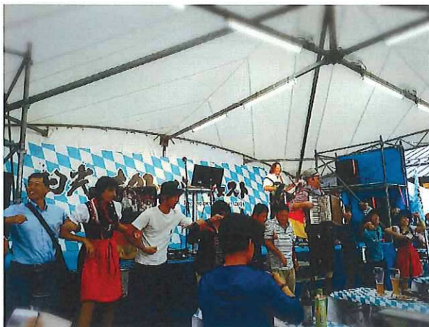
日光オクトーバーフェスト 2016