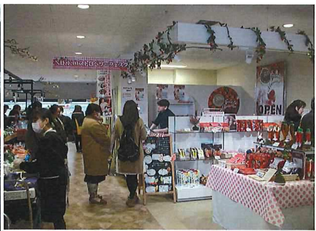
日光ストロベリーフェスタ